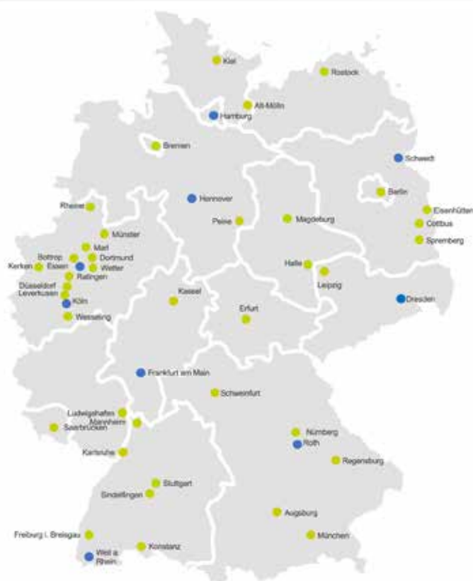
Unser Experten-Netzwerk in Deutschland

Prozessautomatisierung Antriebstechnik GmbH Zunftstraße 6 91154 Roth Tel: +49 (0)91 71 96 56-0